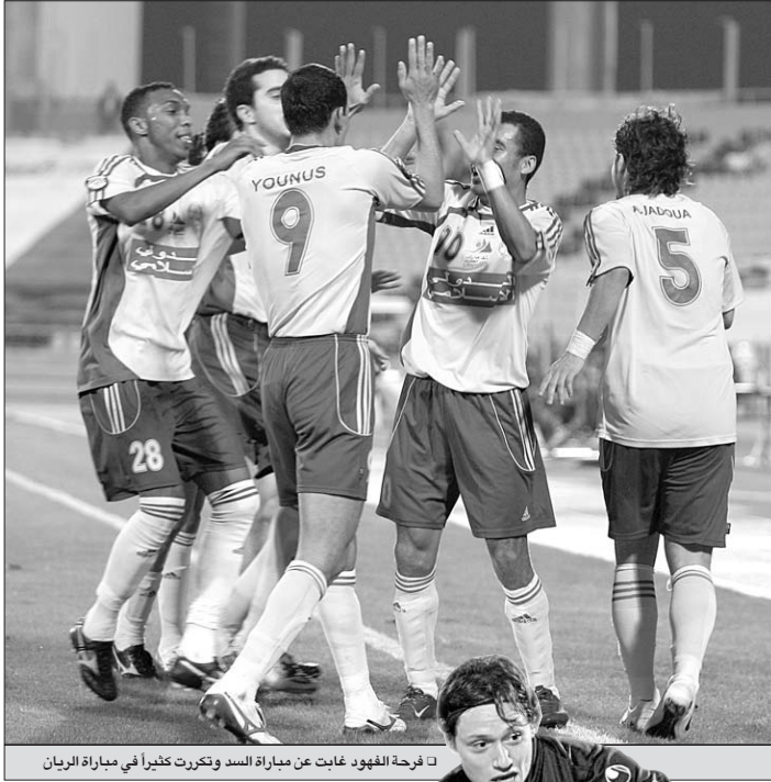
□ فرحة الفهود غابت عن مباراة السد وتكررت كثيراً في مباراة الريان